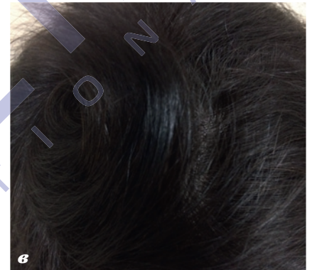
Пациентка К., 44 года: а — до лечения; б — после трех процедур редермализации; в — после завершения курса процедур, включающих редермализацию и плазмотерапию.