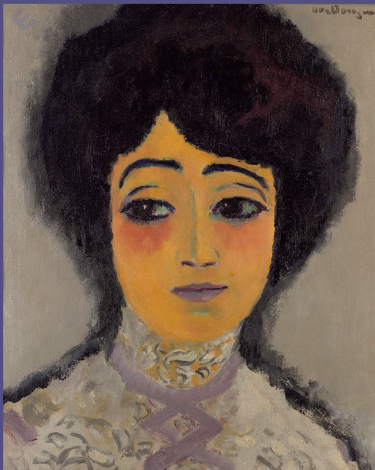
Кес Ван Донген. Испанка